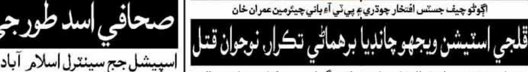
ڪراچي (ر) ڊا. نالي راري وفاقي وزير محمد اورنگزيب اڀرن جي نڪارڻي کي لازمي قرار ڏئي ڇڏيو آهي/بقايا پوهو صفحو 2 نمبر 18