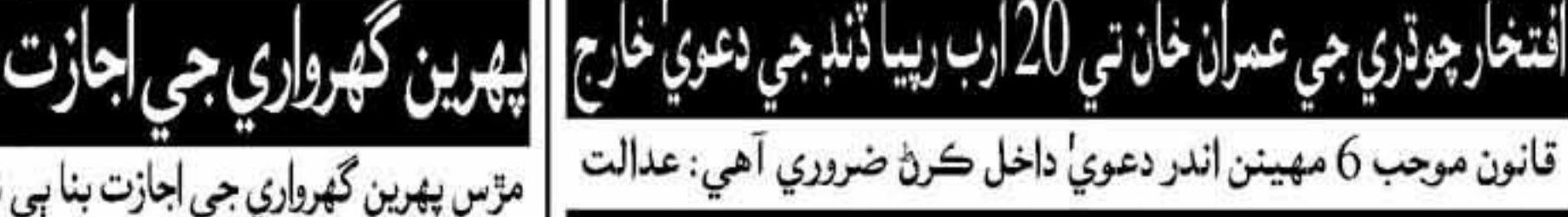
لاهور (ر) ڊا. لاهور جي فيملي ڪورٽ پهرين گهرواري جي اجازت بنا بي شادي ڪندڙ شخص کي سزا ڏيڻي/بقايا پوهو صفحو 2 نمبر 28

مڙس پهرين گهرواري جي اجازت بنا بي شادي ڪئي، بي شادي لاءِ قانوني طور لڪت اجازت وٺڻ ضروري آهي: عدالت. حوالدار مسلم فيملي لاءِ آرڊيننس جي سيڪشن 6 جي چوڪڙي ڪئي، تنهن ڪري کيس 7 مهينا قيد جي سزا ڏني وڃي ٿي.