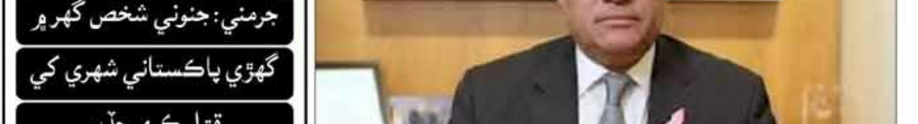
وفاقي وزير محمد اورنگزيب (ڦاٽل فونو)