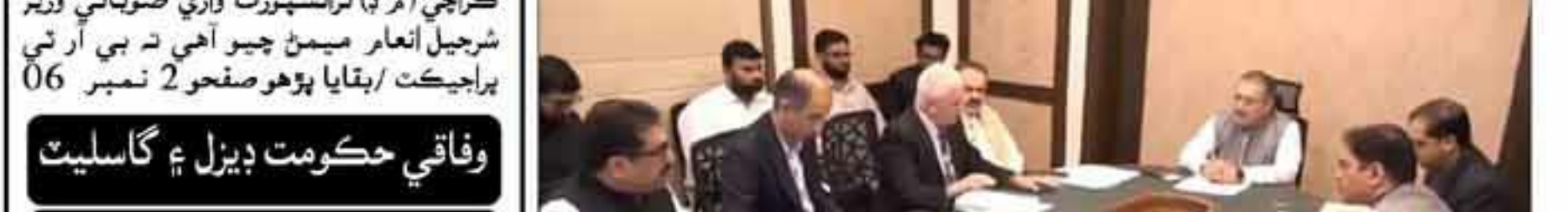
ڪراچي (ر) ڊا. نالي راري وفاقي وزير محمد اورنگزيب اڀرن جي نڪارڻي کي لازمي قرار ڏئي ڇڏيو آهي/بقايا پوهو صفحو 2 نمبر 18

شرجيل انعام ميمڻ جي صدارت هيٺ ٽرانسپورٽ کاتي جو اعليٰ سطحي اجلاس، سيڪريٽري ۽ ٻين جي شرڪت. پراجيڪٽ و اڳواڻي گهڻي دير ٿي چڪي آهي، عوام جي مسئلن جي حل لاءِ رٿا کي جلد کان جلد مڪمل ڪيو وڃي: صوبائي وزير. عوام بي صبري سان منصوبو مڪمل ٿيڻ جو انتظار ڪري رهيو آهي، سمورا اسٽيڪ هولڊر گڏ رهي رٿن کي ختم ڪرڻ کي يقيني بڻائڻ.