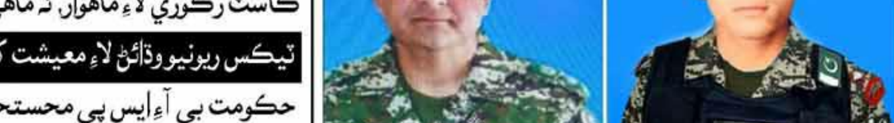
شهيد ليل ليفٽيننٽ ڪرنل سيد ڪاشف علي ۽ ڪيپٽن محمد احمد بدر

ڪاسٽ رڪوري لاءِ ماهوار، ٽه ماهي ۽ سالياني ايڊجسٽمينٽ ڪئي ويندي: آءِ ايم ايف کي خطري ڪرائي ڇڏي. ٽيڪس روينيو وڌائڻ لاءِ معيشت کي جيتوڻي جو ٽيڪس دستاريزي شڪل ڏيڻ جي به خطري ڪرائي وئي. حڪومت بي آءِ ايس بي محسوتحن جو انگن جون تائين وڌيڪ وڌائڻ جي به خطري ڪرائي ڇڏي.