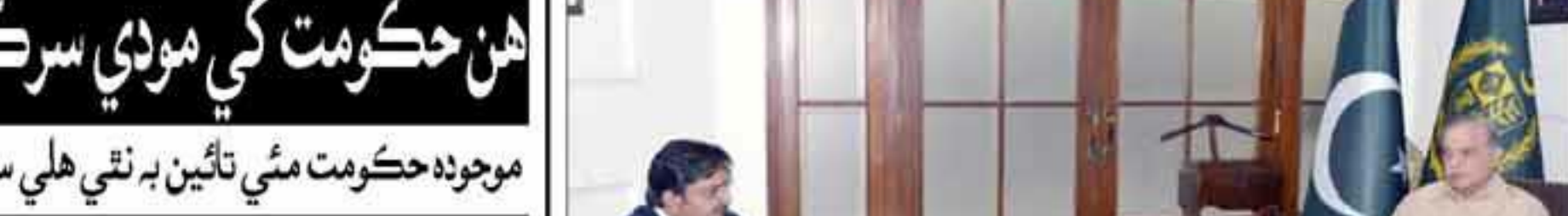
رولپنڊي: آرمي چيف جنرل عاصم منير سان بحرين نيشنل گارڊ ڪمانڊر جي ملاقات ڪندي

موجوده حڪومت مٿي تائين نه نفي هلي سگهي، يورپي يونين جي ڪنهن به ملڪ هن حڪومت کي مبارڪباد نه ڏئي آهي. مولانا فضل الرحمان جيڪڏهن لاڳ مارج جو فيصلو ڪري ورتو ته حڪومت ختم ٿي ويندي. هن هٿ ٺوڪڻي حڪومت کي هٽائڻ و خيبرپختونخواهه حڪومت جو اهو ڪردار هوندو: صحافين سان ڳالهائين